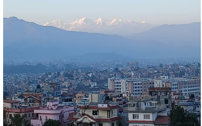
Vuorten jylhyys ja majesteettinen kauneus huumaavat.

Tästä alkaa uusi toivon ja palvelun luku elämässämme. Kirjoitan tätä uutiskirjettä iloisin, kiitollisin ja odottavin mielin Nepalin Lalitpurissa. Nyt kun tämä askel on totta, odotan liki malttamattomana, että pääsen tekemään työtä kokonaisvaltaisesti. Erityisesti odotan pääseväni näkemään ja kokemaan paikan päälle kumppaniemme syvällistä paikallistuntemusta, kulttuurista ymmärrystä ja yhteisöjen tarpeista kumpuavaa toimintaa. Itse olen ilolla oppijan paikalla tukemassa kumppaneitamme olemaan toivon ja rakkauden majakoita tavalla, joka on linjassa myös Suomen Lähetysseuralle tärkeiden arvojen kanssa.