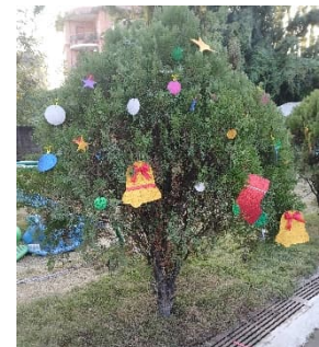
Joulupuu, jouluihin on myös sydämen maisema.

”Toivon toivoa, rauhaa, rakkautta, hyvää tahtoa, kättä auttavaa ja mieltä avointa, tunteen tulipaloo... ja vähän suklaata.”