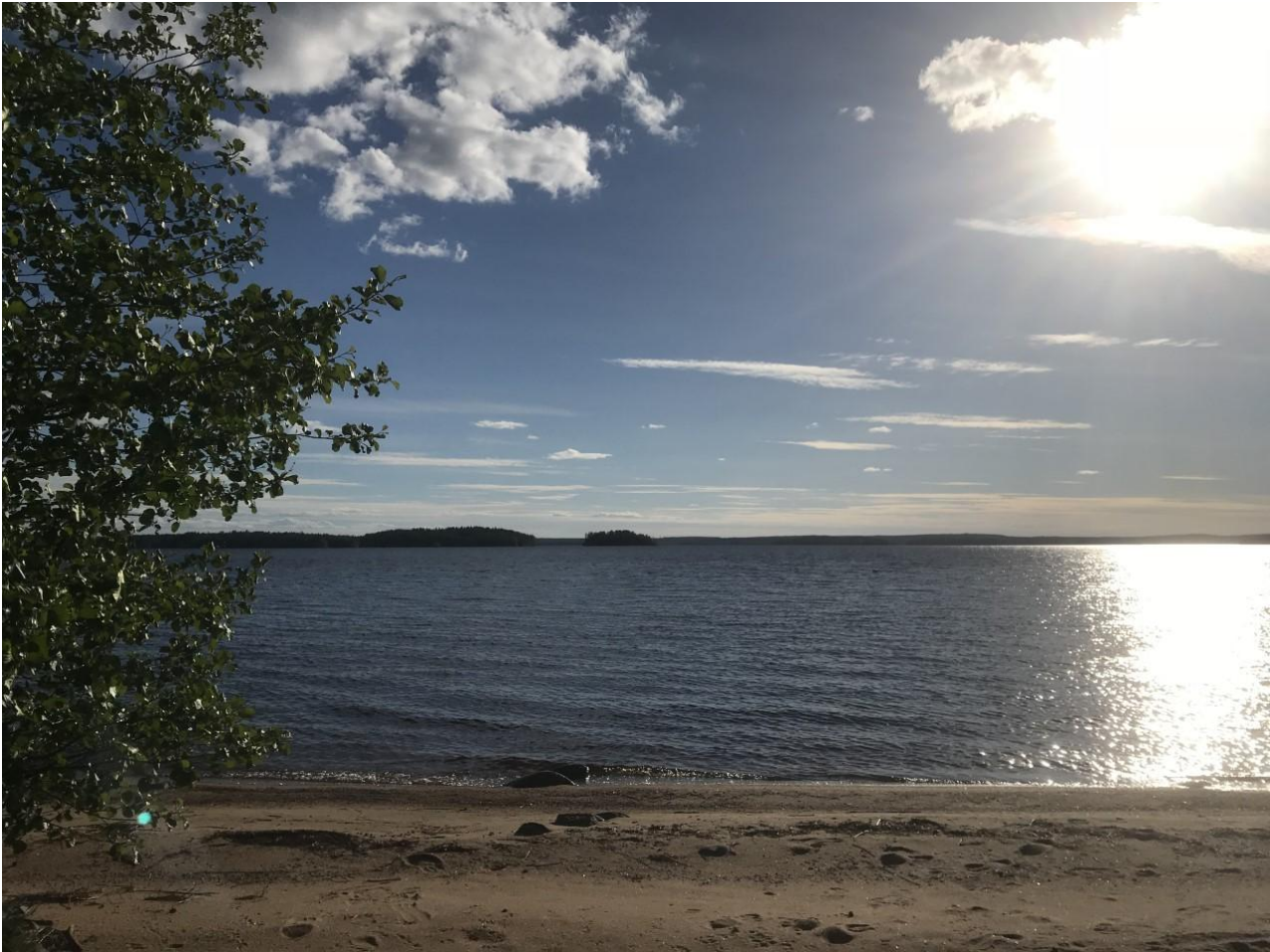
Kuva: Isohiekan leirikeskus