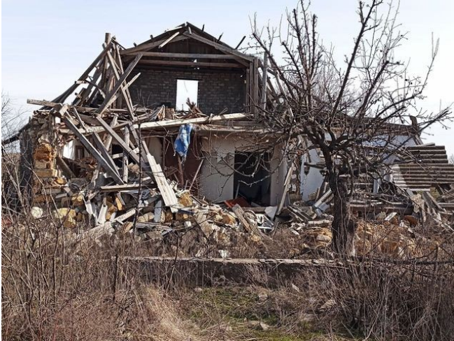
Kuva. Taistelujen jälkiä kylissä.