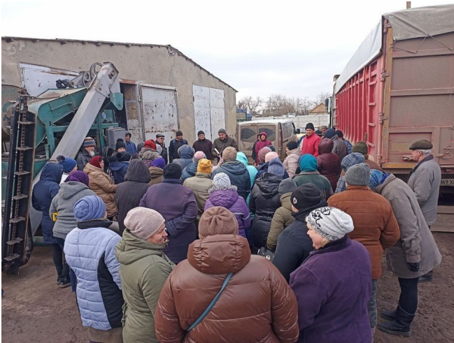
Kuva. Sanan ja ruoan jakoa kylissä