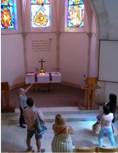
Vastaanottamista ja opastusta Immanuel kirkossa

pitkin poskipäitään pyysi esirukousta Ukrainan puolesta. Vieressäni seisoi siis kaksi ukrainalaista nuorta naista, joilla oli sodan keskellä hyviä ystäviä, perhettäkin. Saman tien laskin käteni itkevän naisen harteille ja rukoilimme yhdessä rauhaa ja apua koko kärsivälle kansalle. Kerroin vielä, että kirkossamme kyllä rukoillaan heidän puolestaan, kuten myös tulevan sapatin jumalanpalveluksessa. Heitä ei jätetä yksin. ”Vain Jeesus voi meitä auttaa...”, sopersi nainen vielä pois lähtiessään. ”Niinpä ja aamen!” huokailin itsekin.